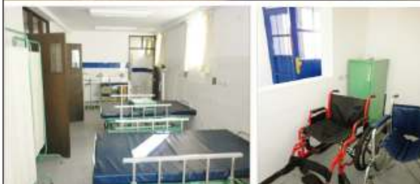
Algunos de los medios con los que cuenta LINCECI para el traslado y cuidado del enfermo

venientes de zonas de pobreza extrema, el hecho de ir a Arequipa o Lima para poder acceder al tratamiento conlleva un gasto en hospedaje y alimentación que muchas veces excede el nivel de ingresos de la familia.